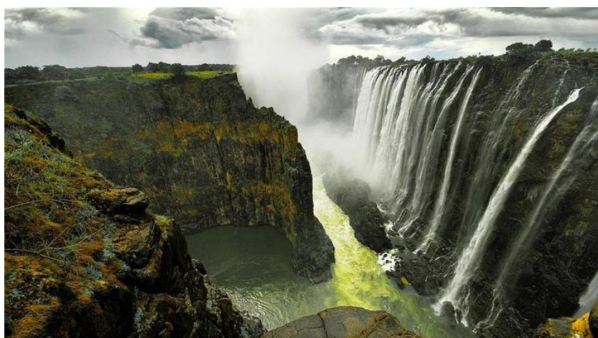
图 3 津巴布韦风景

津巴布韦 1995 年 3 月 5 日加入世界贸易组织 (WTO)。目前, 针对 WTO 最惠国所施行的平均关税税率为 15.8%。津巴布韦参与的一项较重要的多边贸易协定是《科托努协定》(Cotonou Agreement), 其全称为《非加太地区国家与欧共体及其成员国伙伴关系协定》。津巴布韦是东部和南部非洲共同市场 (The Common Market for Eastern and Southern Africa, COMESA) 与南部非洲发展共同体 (Southern Africa Development Community, SADC) 的成员国。