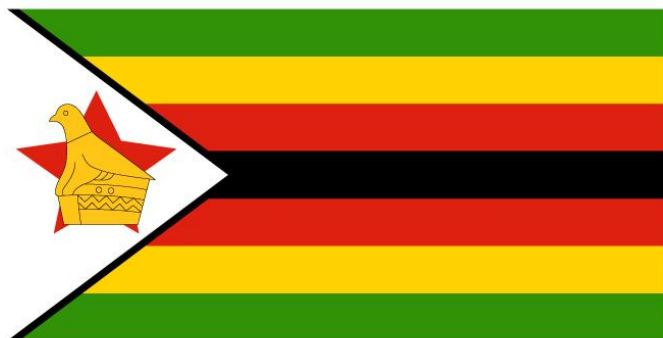
图 2 津巴布韦国旗

2020 年, GDP 为 132 亿美元, 增长率为 4.1%, 人均 GDP 为 1156 美元。